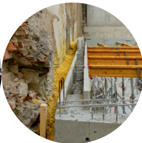
Dämmung der Gebäudetrennfuge

Die technischen Informationen geben unseren derzeitigen Kenntnisstand und unsere Erfahrungen wieder. Die beschriebenen Einsatzbereiche können besondere Verhältnisse des Einzelfalles nicht berücksichtigen und erfolgen daher ohne Haftung. Bitte berücksichtigen Sie den jeweiligen Stand der Technik sowie die Regeln des Fachs. Irrtümer, technische Änderungen und Druckfehler vorbehalten.