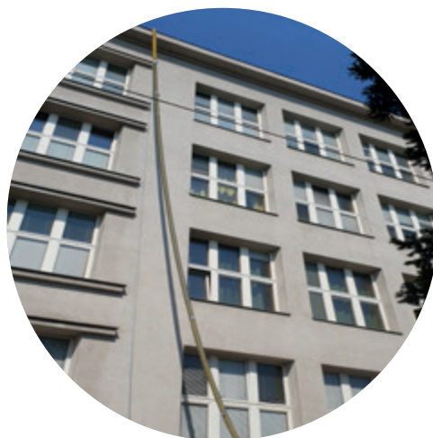
Öffentliche Schule in Wien