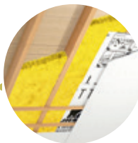
Dämmung zwischen den Sparren im Steildach