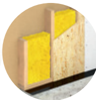
Dämmung in Holzrahmen-Konstruktionen