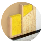
Dämmung in Holzrahmen-Konstruktionen