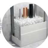
Dämmung von Schächten und Hohlräumen